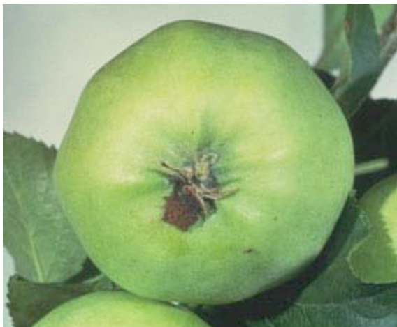
Coutin / OPIE

Cette collaboration est liée à la volonté de chacun de trouver des méthodes durables de protection du pommier dans un environnement à protéger.