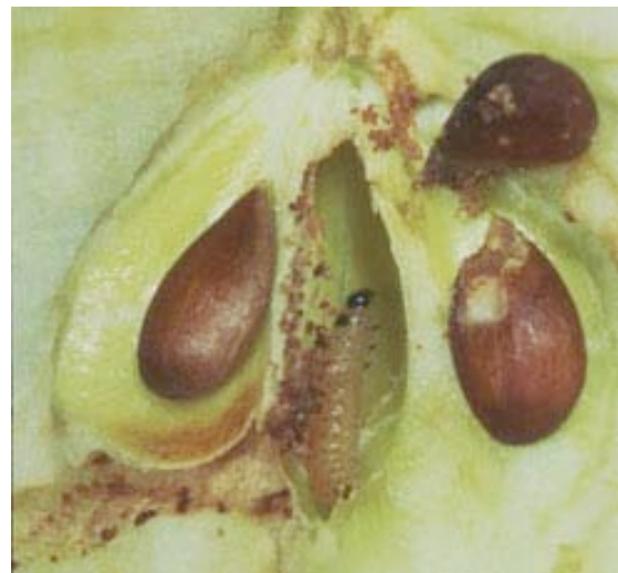
Coutin / OPIE