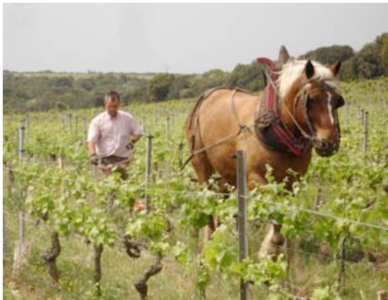
Dans les vignes de Châteauneuf (A. Jacobsohn)

Créée en 1996, l'association des Sites remarquables du goût regroupe aujourd'hui 70 membres représentant toute la gamme possible des produits agricoles et alimentaires, de la mer, des rivières et des étangs, aux boissons et confiseries, en passant par les produits des élevages, du maraîchage et de l'arboriculture fruitière.