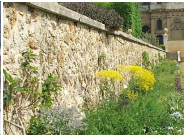
Jardin Lelieur avril 2007 (J. Meynard)