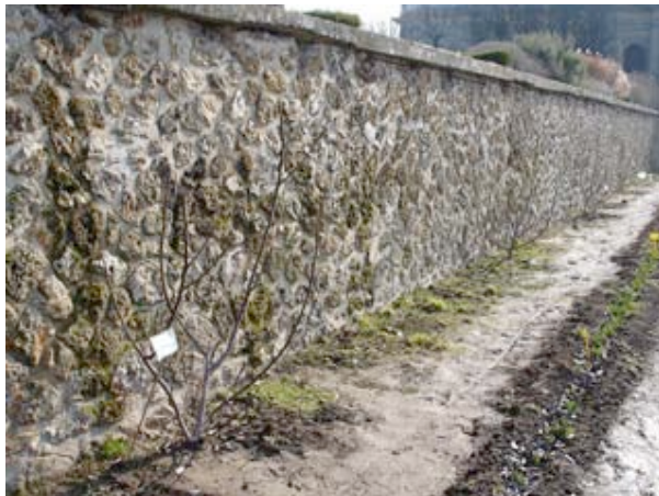
Jardin Lelieur, mars 2006 (A. Jacobsohn)