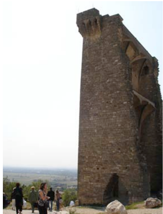
Le château de Châteauneuf-du-Pape et la plaine du Rhône (A. Jacobsohn)